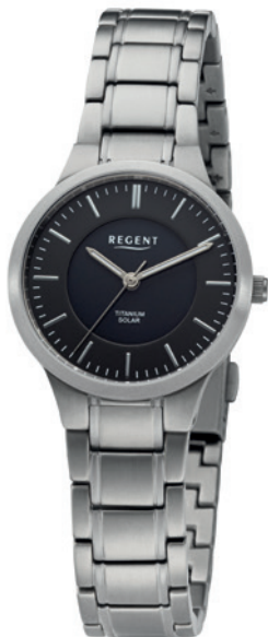
BA-711 Titan, 5 Bar UVP 188,00 €