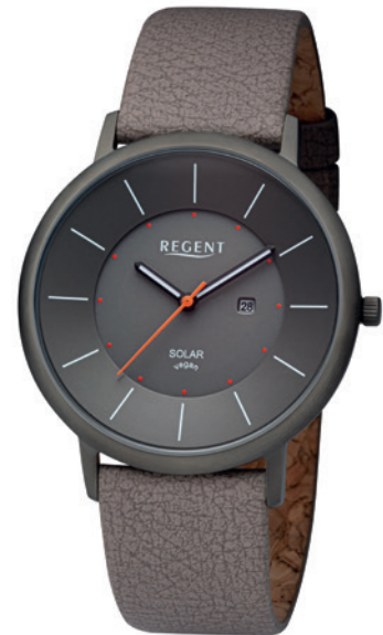
BA-723 Edelstahl IP gun, 3 Bar UVP 158,00 €