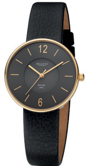
BA-720 Edelstahl IPG, 3 Bar UVP 148,00 €