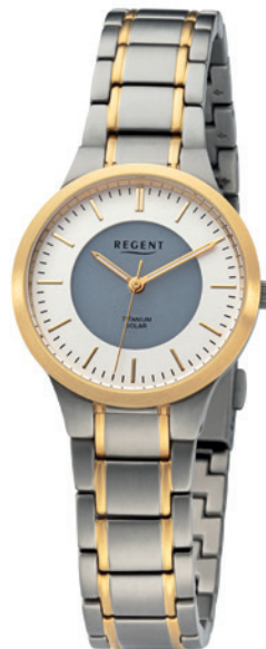
BA-713 Titan IPG, 5 Bar UVP 198,00 €