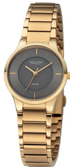
BA-730 Edelstahl IPG, 5 Bar UVP 168,00 €