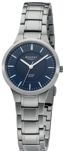
BA-712 Titan, 5 Bar UVP 188,00 €